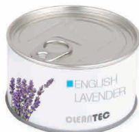
110ml Dosen/Karton 6 Art-Nr. 10000000116