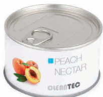
110ml Dosen/Karton 6 Art-Nr. 10000000115