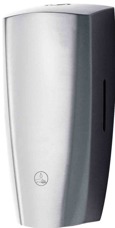
■ inoxDISP™ senseFOAM 1000ml HxBxT 276x157x124 Art-Nr. 1000000190

Die inoxDISP Edelstahl-Spenderserie von CLEANTEC verkörpert eine zeitlose, luxuriöse Eleganz und bietet Ihnen die hygienischste Form der Reinigung. Die berührungsfreien Spender verfügen über eine intelligente Sensortechnik und beeindrucken durch perfekte Schaumqualität.