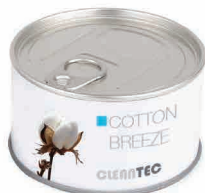
110ml Dosen/Karton 6 Art-Nr. 10000000114