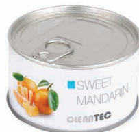
110ml Dosen/Karton 6 Art-Nr. 10000000117